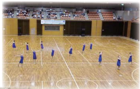
バドントワリグ部