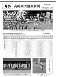
▲令和元年7月21日 号外