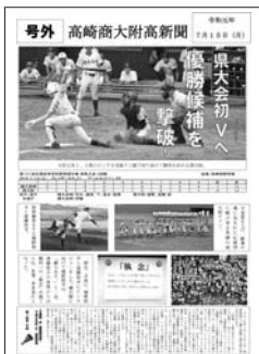
▲令和元年7月15日 号外