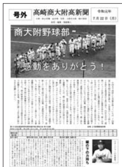
▲令和元年7月22日 号外

ました。これからも本校生徒の活躍を伝え、学校全体を盛り上げていきたいと思えます。