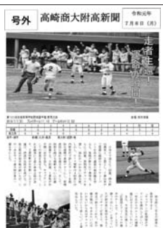
▲令和元年7月8日 号外