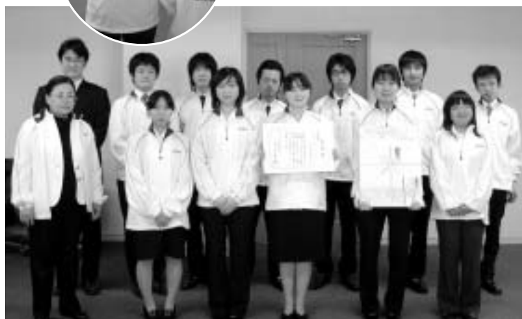
▶ ボランティアサークルの皆さん

本学のボランティアサークル（愛称：チョコボラ隊）がこれまでの活動を認められ、財団法人ソロプチミスト日本財団から社会ボランティア賞（青少年の部）を贈与されました。この賞は、地域社会のニーズに適合した地域密着型のボランティア活動を地道に行い貢献している人に贈られるもので、特に青年の部は、将来社会を担う若者に健全な精神を養ってほしいという目的で設定されています。