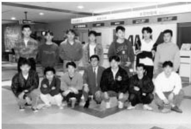
▲ 北海学園北見大学吉岡ゼミ第2・3期生と (1992年、女満別空港にて)

その後、中学、高校、大学・大学院へと進み、いつの間にか、時間が猛スピードで過ぎていくのが感じられるようになった。今はもっとスピードが増している気がしてならない。まさに「光陰矢のごとし」である。