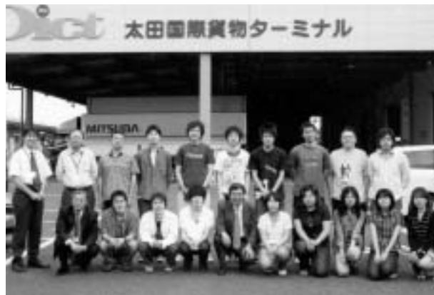
▲ 高崎商科大学吉岡ゼミ第4・5期生と (2008年、太田国際貨物ターミナルにて)

私は来年、還暦を迎える。「加齢」という言葉は、ネガティブなイメージがあって好きではないが、現実だから仕方がない。年をとれば誰だって、その年齢に合わせた風貌に変わるの当たり前だし、個人差はあるものの、体力の衰えから、仕事をこなすスピードも鈍化する。しかし、変わらないこともある。それは、周りにいる学生諸君だ。私が相手にするのは常に、多感な青年たちである。彼ら、彼女らに理想を語り、同時に、現実を直視する大切さを説いている。教師冥利に尽きる思いである。