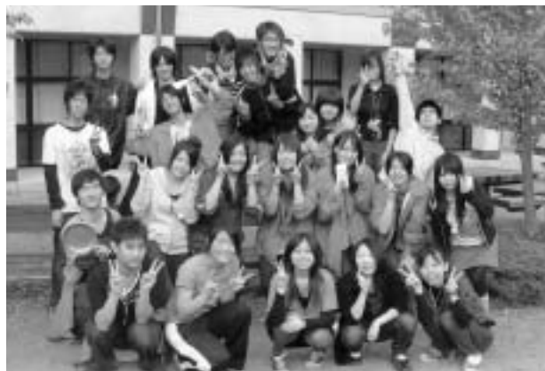
▲ 昨年度の彩霞祭実行委員

少しでも興味がある人は、1号館食堂奥にある彩霞祭実行委員室にいつでも遊びに来てください♪話を聞いただけ…もちろんOKです!お待ちしております♪