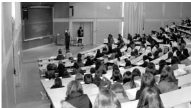
▶ 学科長によるあいさつ

また、教養演習の位置づけや単位制・コース制、GPA制度などについて説明が行われ、全体の説明終了後には、各コースごとに分かれてアンケート調査などが行われました。