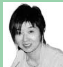
神戸絹恵 科目：イベント プランニング