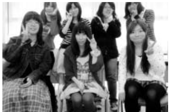
彩霞祭実行委員会メンバー

昨年より素敵で楽しい彩霞祭にするためには、まだまだ実行委員メンバーが足りません!そこで実行委員と一緒に学園祭を盛り上げてくれる方を大募集集中です!!!!彩霞祭実行委員会の仕事は、イベントの企画運営・パンフレットの作成など彩霞祭を楽しく盛り上げるための仕事をします。とてもやりがいのある素敵な委員会なので興味がある方は1号館学生ホールにある彩霞祭室へ遊びに来てください!!お待ちしております(・v・)☆!